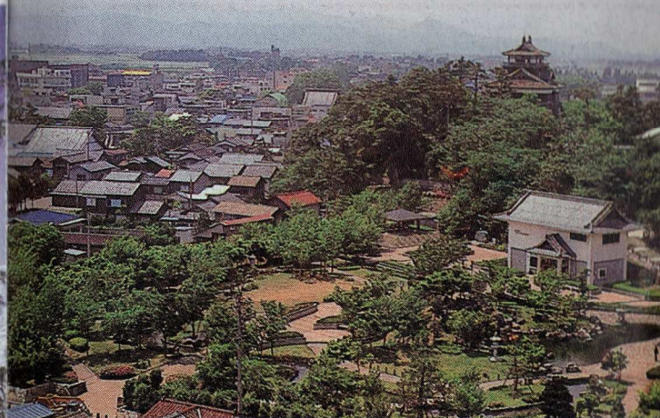
丸岡城の手に資料館、霞ヶ城公園があります。